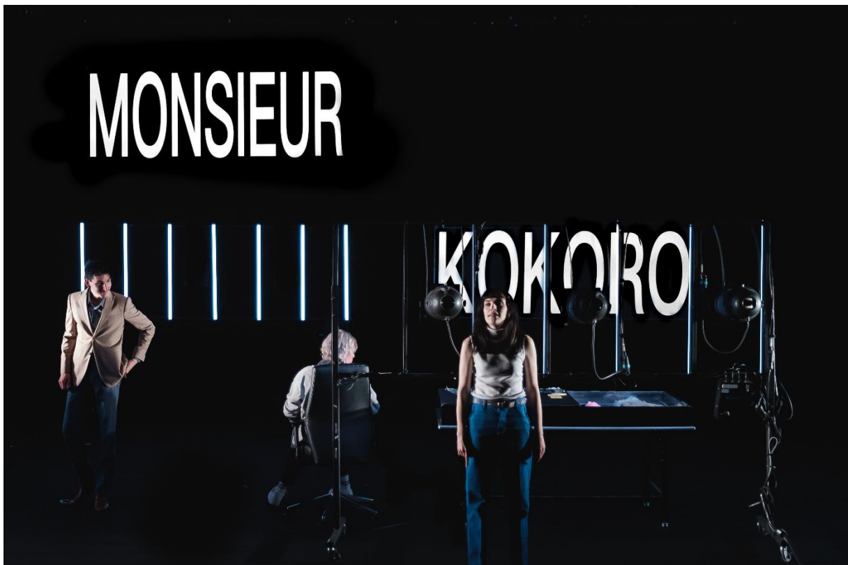
Rabudôru, poupée d'amour © Alban van Wassenhove, novembre 2020

Inquiet du repli identitaire, du vieillissement des consciences, du retour d'une certaine tragédie de l'ordre moral, Olivier Lopez souhaite inscrire le travail de la compagnie sur les trois prochaines années autour des problématiques liées à la place réservée à la jeunesse.