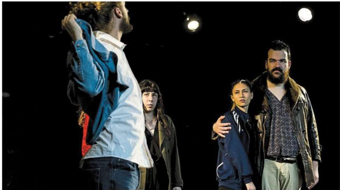
Quatre des douze élèves du Groupe 13 des comédiens-stagiaires de La Cité Théâtre. Leurs trois ans de formation s'achèvent en décembre.

Nuance de taille : ici, la formation ne coûte pas 5 000 € par an. Intégralement prise en charge par le service « formation professionnelle » de la Région Normandie, elle est totalement gratuite pour les stagiaires. Cer-