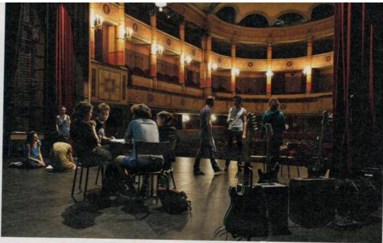
Le théâtre du Conservatoire national supérieur d'art dramatique, à Paris (CNSAD).